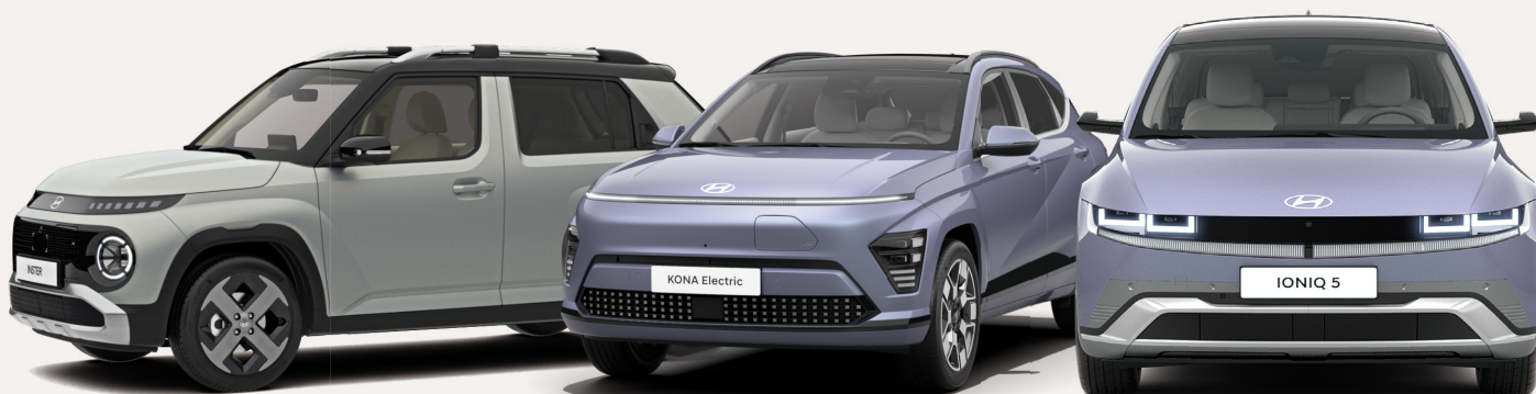
Abb. zeigen aufpreispflichtige Sonderausstattung

Hyundai INSTER EV Select Elektromotor mit 71 kW (97 PS) mit 42 kWh Batterie Top-Ausstattung inklusive Hauspreis netto 17.975 €